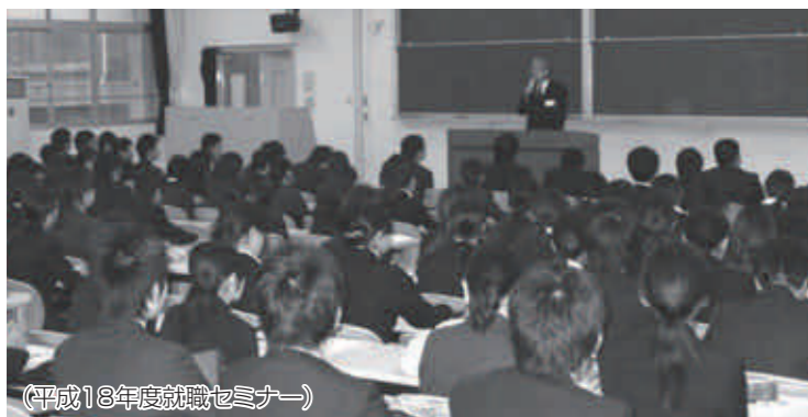
(平成18年度就職セミナー)

を円滑に進めることが出来た大きな要因だったと感じています。就職活動も終わり、これからは残りの少ない学生生活を楽しくむとにも、資格取得にも挑戦していこうと考えています。 最後になりましたが、同窓会の皆様には「佐世保セミナー」の際は本当にありがとうございました。そして、これから就職活動を始めよう後輩へのご指導もよろしくお願ひいたします。