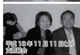
平成18年11月11日(土) 支部総会