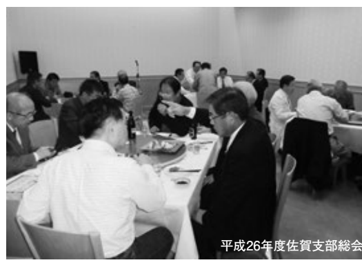
平成26年度佐賀支部総会