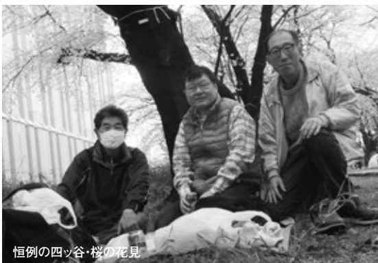
恒例の四ツ谷桜の花見

かつて参加された方、また参加されていない方にも是非ともお聞かせしたい話ですので、時間以上の熱演をダイジェストでご紹介いたします。