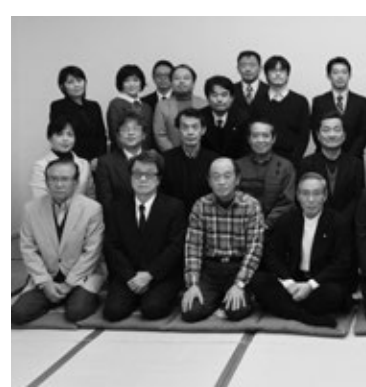
平成27年度長崎支部総会

一生のおつきあいをする場所ではないかと。私は長崎県立大の人を見てきて、よく思うことがあります。皆様が真面目であること。それと、両極の人の集まりだと感じます。