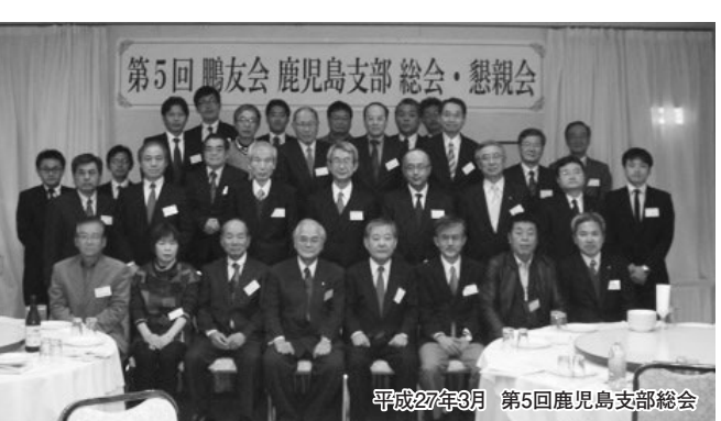
平成27年3月 第5回鹿児島支部総会

「今年たつても、仲間は仲間」卒業生の皆さんが世代を超えて、地域を超えて楽しく集える鹿児島支部を作っていきます。